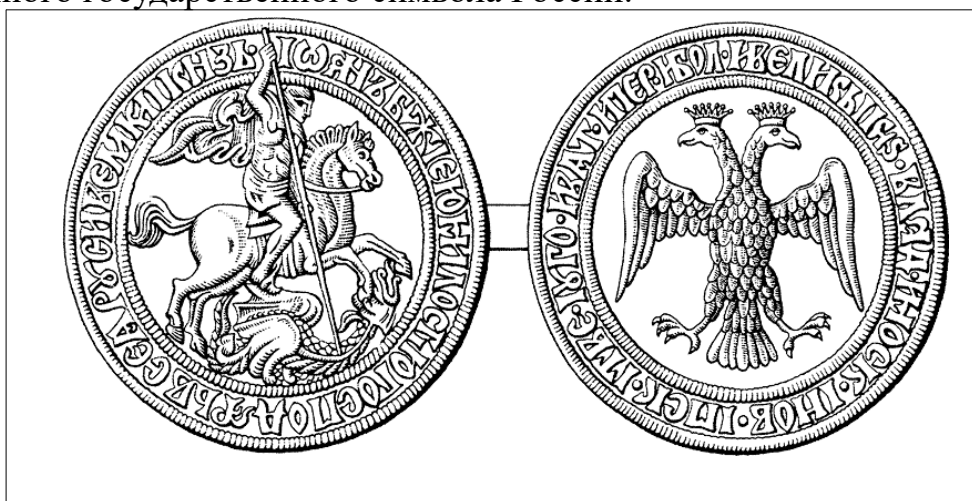
Оборотная сторона печати Ивана III с перечислением его титулов и двуглавым орлом

История герба Ивана III, знаменующая собой зарождение официальной государственной символики в России, открывает ключевой этап в формировании российского государственного самосознания и его внешнего вида. Именно в XV веке, в эпоху правления Ивана III, впервые на печати государя появилось изображение двуглавого орла как символа объединения русских земель. С тех пор двуглавый орел прочно закрепился в государственной символике России, пережив множество изменений и дополнений в зависимости от эпохи и правления различных монархов. Этот герб стал предшественником современного государственного символа России.